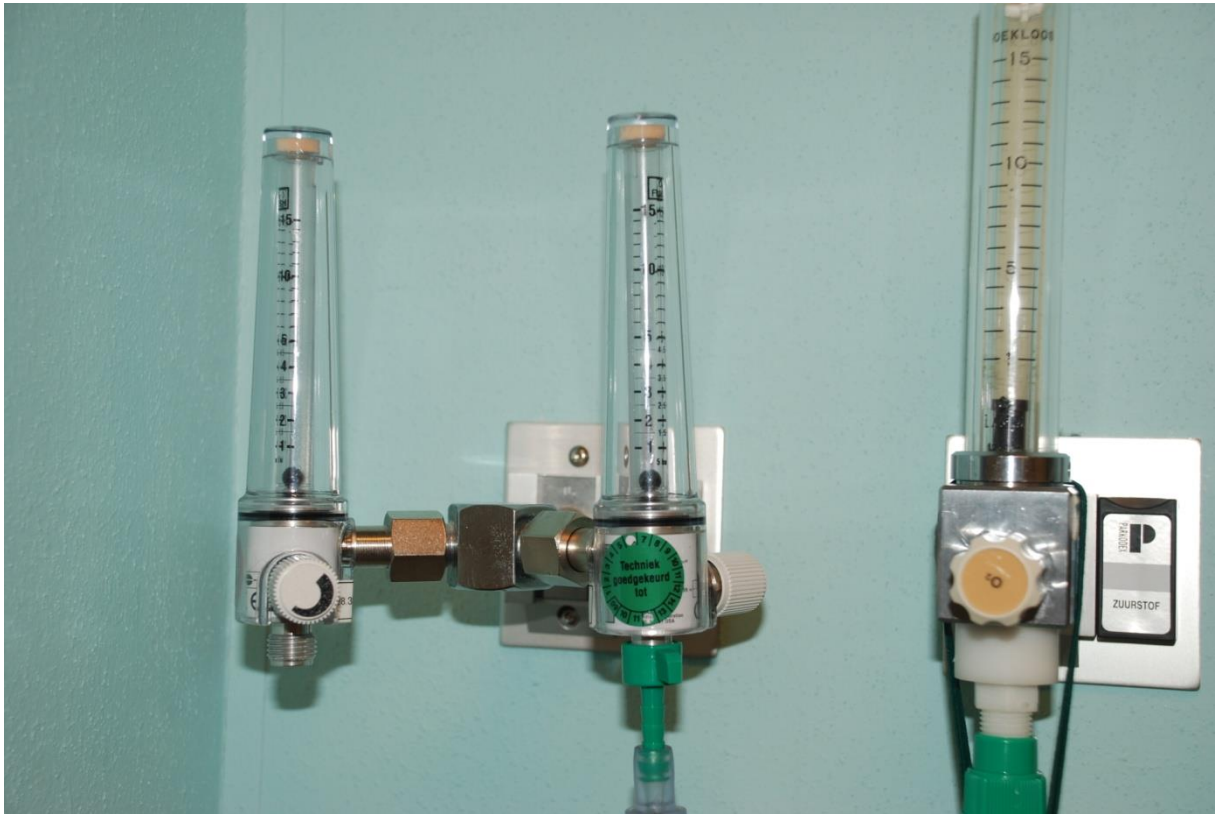
Dit is een zuurstofklok.